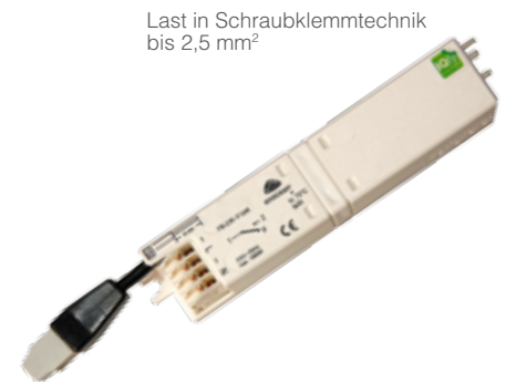
Last in Schraubklemmtechnik bis 2,5 mm 2