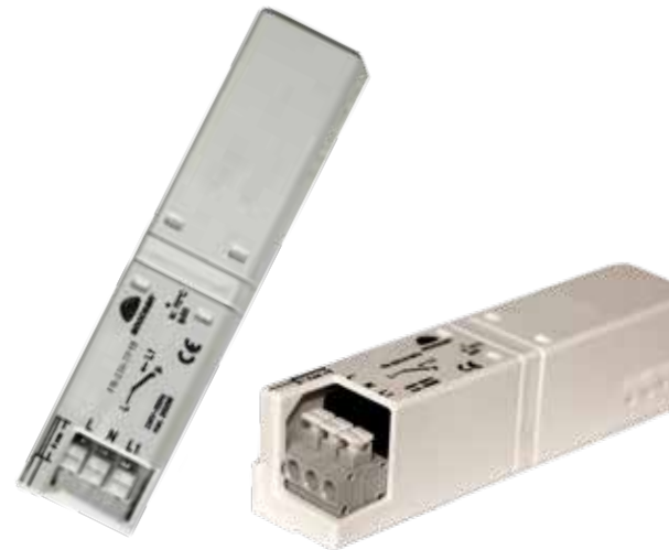
Steckklemme bis 2,5 mm 2

Applikationsbeispiel: Touch-Dimm-Betrieb mit Funk-Tasterfolger-Empfänger für Leuchten