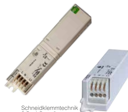
Schneidklemmtechnik 0,5 - 1,5 mm 2

Applikationsbeispiel: Touch-Dimm-Betrieb mit Funk-Tasterfolger-Empfänger für Leuchten