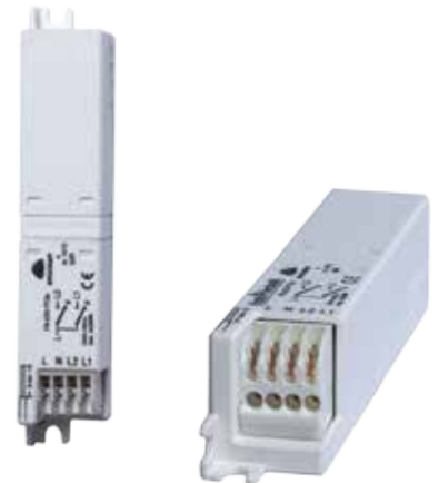
Schneidklemmtechnik 0,5 - 1,5 mm 2