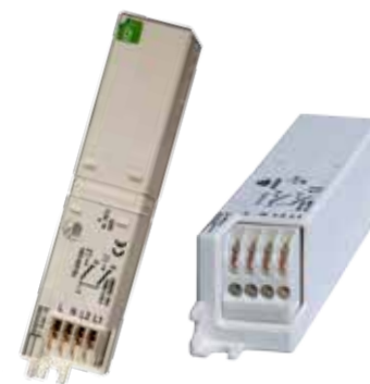
Schneidklemmtechnik 0,5 - 1,5 mm 2

Über Taste 0 und 1 können Zusatzfunktionen geschaltet werden