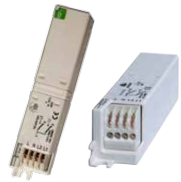
Schneidklemmtechnik 0,5 - 1,5 mm 2

Über Taste 0 und 1 können Zusatzfunktionen geschaltet werden