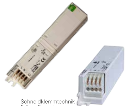
Schneidklemmtechnik 0,5 - 1,5 mm 2

Applikationsbeispiel: Touch-Dimm-Betrieb mit Funk-Tasterfolger-Empfänger für Leuchten